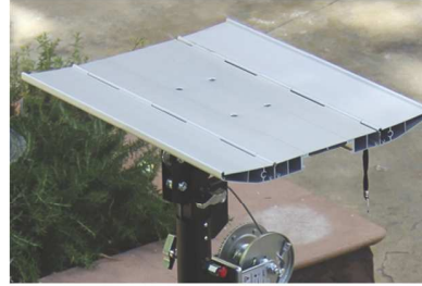
BC-07 ADAPTADOR BANDEJA