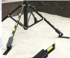
CPS-02 CALZOS PARA ELC-720