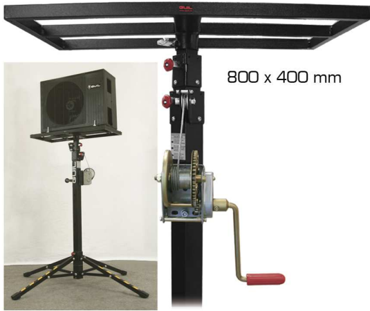
BC-02 ADAPTADOR BANDEJA