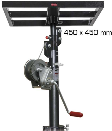
BC-06 ADAPTADOR BANDEJA