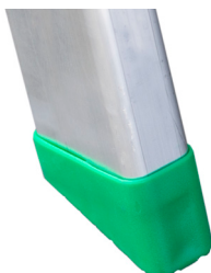
Taco 5 x 2 cm. (2 unidades).