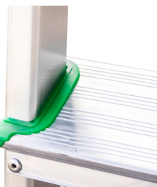
Embellecedor peldaño (2 unidades).