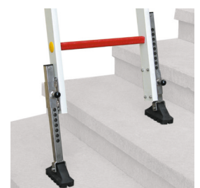
PATAR Pata regulable.